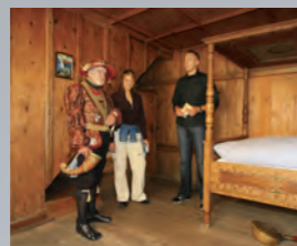
Fuggereimuseum, Mittlere Gasse 13 en 14