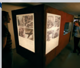
Wereldoorlogsbunker, tentoonstelling over de verwoesting en wederopbouw van de Fuggerei, toegang via het park